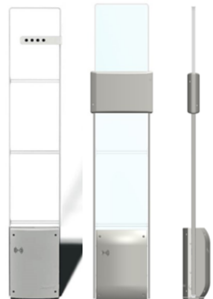
Con contapersone integrato (opzionale)

Sfrutta i principi Active/Active e Passive/Passive