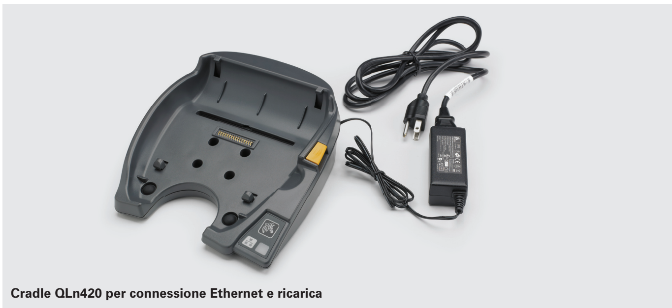
Cradle QLn420 per connessione Ethernet e ricarica